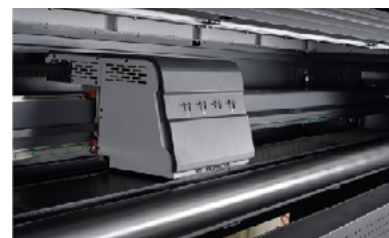
Motor servo Panasonic